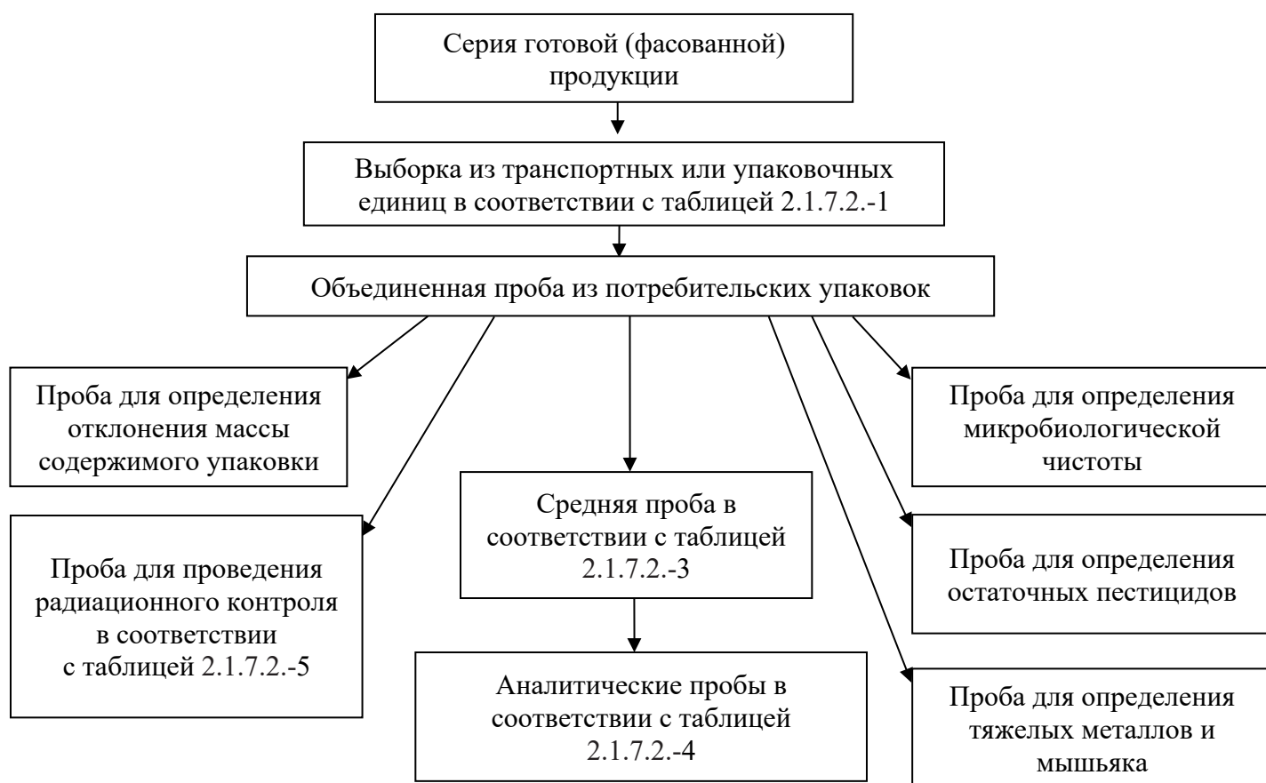
Рисунок 2.1.7.2.-2. – Схема порядка отбора проб от серии ЛРП

Единицы продукции в выборку необходимо отбирать случайным образом или методом систематического отбора. Объем выборки зависит от количества транспортных или упаковочных единиц в серии ЛРП (таблица 2.1.7.2.-1).